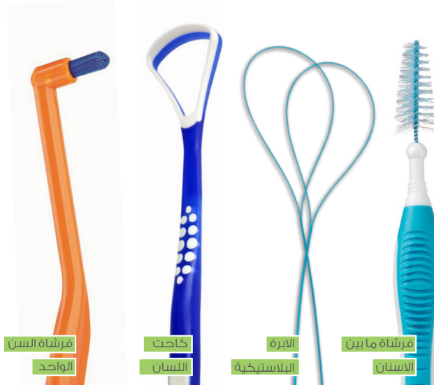
فرشاة السن الواحد

هي أداة بلاستيكية أو معدنية ستخدم لتنظيف اللسان من بقايا الطعام، ويسمى لتنظيف الأسنان المتراكبة وخصوصا تلك التي يصعب الوصول إليها بالفرشاة العادية